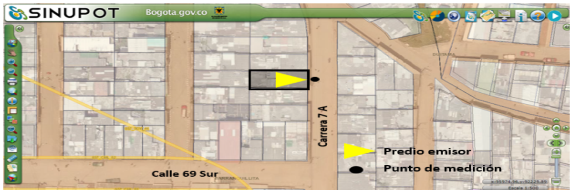
Figura 1. Ubicación del predio emisor y punto de medición.

Nota 3: Datos suministrados en el Anexo No 6. Reporte Uso de suelo.